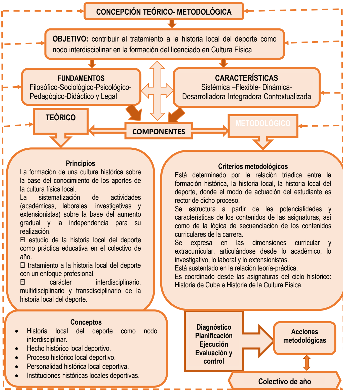
Figura 1. Representación gráfica de la concepción teórico-metodológica.