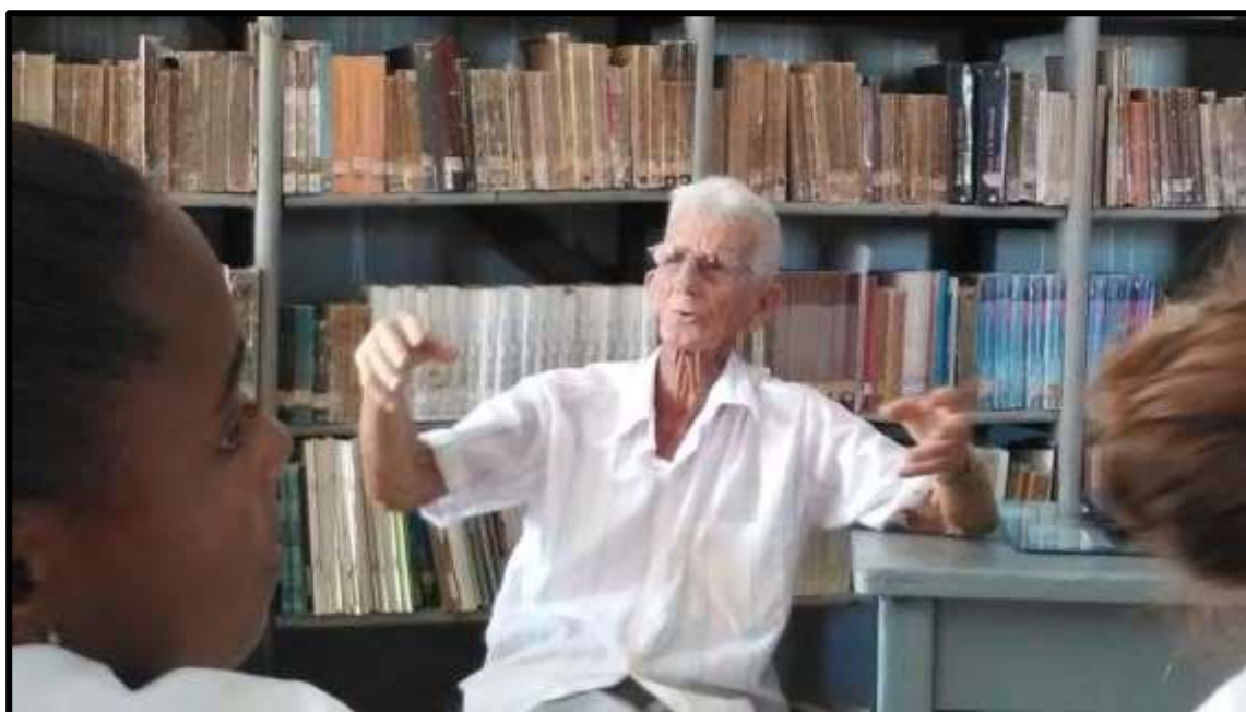
Visita al Museo de Bomberos de la ciudad de Matanzas.