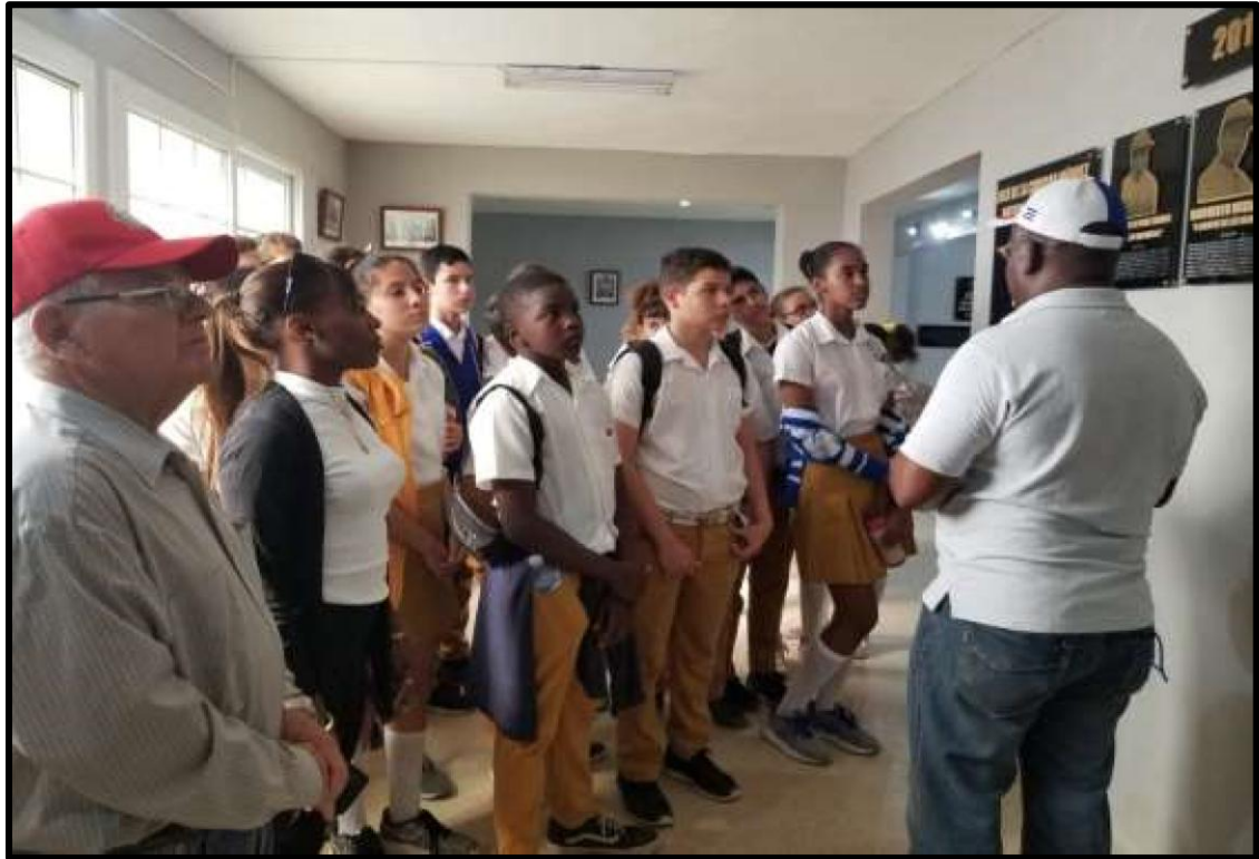
Recorrido por Narv ez para la apreciaci3n del entorno f sico de la ciudad