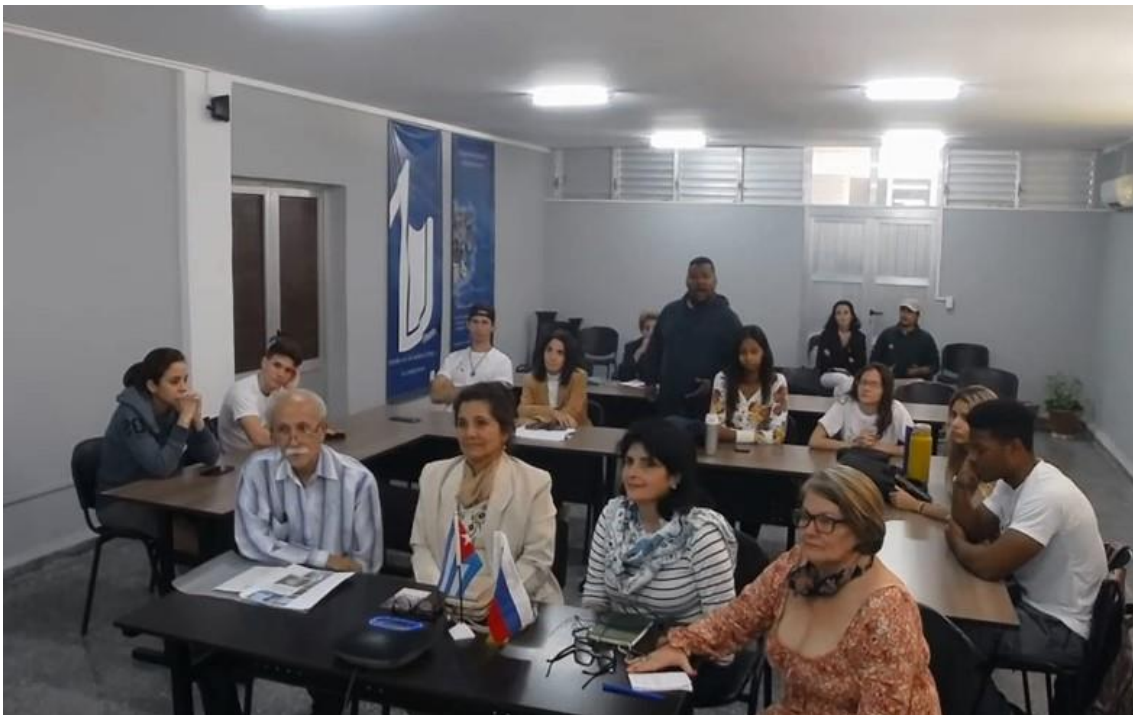
Figura 4 Inauguración Certamen Cuba-Rusia Universidad de Matanzas