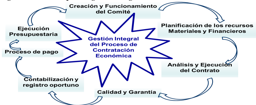
Figura 1: Variables para la gestión integral de la Contratación Económica