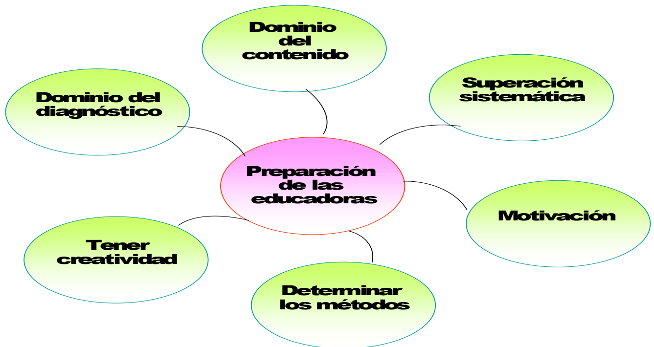
Gráfico 1 Preparación de las educadoras