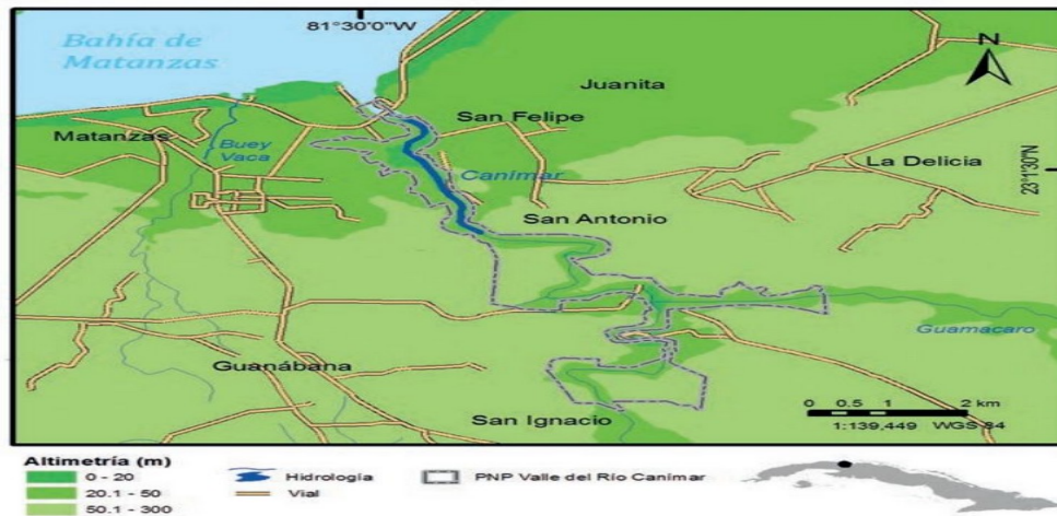
Figura 1: Representación del Paisaje Natural Protegido (PNP) Valle del Río Canímar.

hectáreas que ofrecen el atractivo de un valle de origen fluvial que emerge desde ambos lados del río que da origen a su nombre.