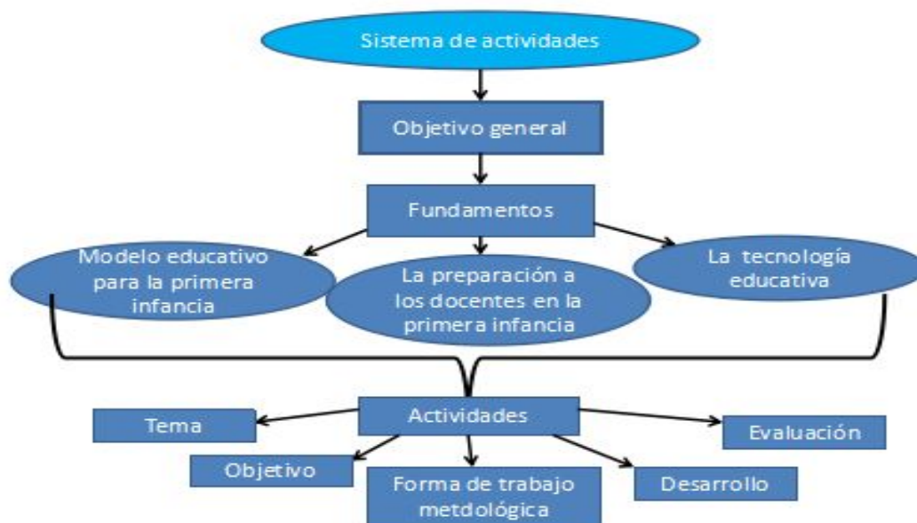
Gráfico 1 Estructura del sistema de actividades

En esta investigación el sistema de actividades tiene como objetivo general preparar a los docentes para en el empleo del Pá que te eduques en la primera infancia .