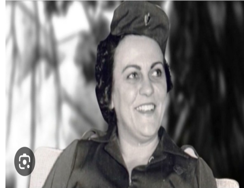
Las "casas de Pastorita" en La Habana"1