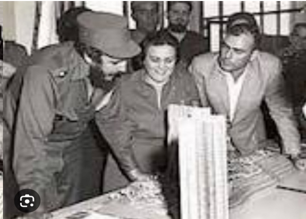
Con Pastorita Núñez | Fidel soldado de las ideas