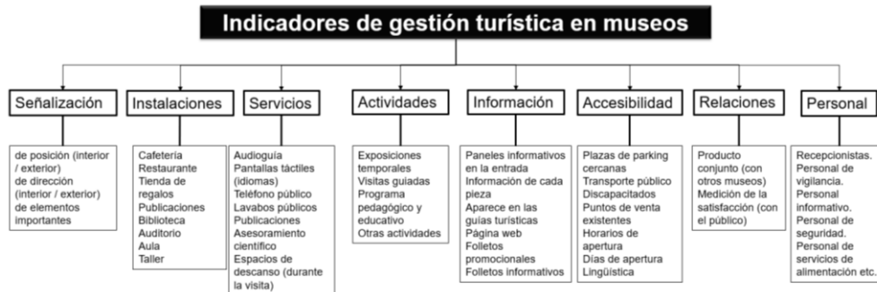
Figura 1. Indicadores de gestión turística