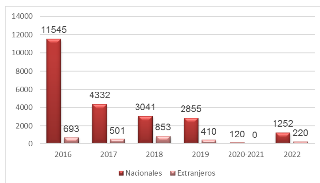
Gráfico 2. Número de visitantes nacionales y extranjeros (2016-2022)

Asimismo, en el período analizado, el número de visitantes nacionales sobrepasa de forma considerable las visitas internacionales.