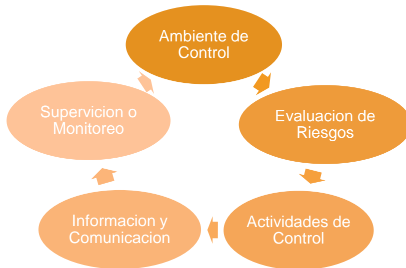
Figura 3. Los componentes de Control Interno

El sistema de Control Interno lo conforman cinco componentes (ver figura 3) que se interrelacionan entre sí, en el marco de los principios básicos de: legalidad, objetividad, probidad administrativa, división de funciones, fijación de responsabilidades, cargo y descargo y autocontrol. Dada su importancia encuentran regulación en la Resolución No. 297-2003 del Ministerio de Finanzas y Precios como aspectos a desarrollar dentro del Sistema de Control Interno (SCI). (Solorzano, 2016).