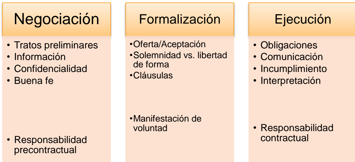
Figura 2: Etapas del Proceso de Contratación