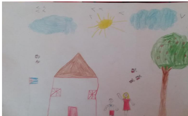
Imagen 2. Dibujo sobre familia. (Estudiante HTD)