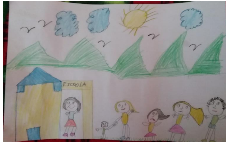
Imagen 1. Dibujo sobre familia. (Estudiante ADG)

A continuación, se presenta una muestra de los dibujos elaborados por los escolares de primer grado.