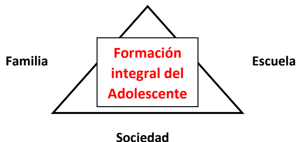
Esquema 1. Sinergia que caracteriza el sistema de influencias en la formación integral de la personalidad de adolescente. (Elaboración propia)

Luego de una reflexión sobre las concepciones de Arana y Batista referida a los retos que impone el siglo XXI a la educación familia, se ratifica la idea de que la familia y su proyección educativa son insustituibles. Esta agencia socializadora de la educación, a través del sistema de influencias e interacciones recíprocas que desarrollan sus miembros propone patrones de conducta a los adolescentes, que están condicionados por la propia sociedad, la estructura social de la familia y la educación familiar. En el siguiente esquema se grafica el lugar que ocupa la formación integral del adolescente en el sistema de influencias que recibe de la familia, la escuela y la sociedad.