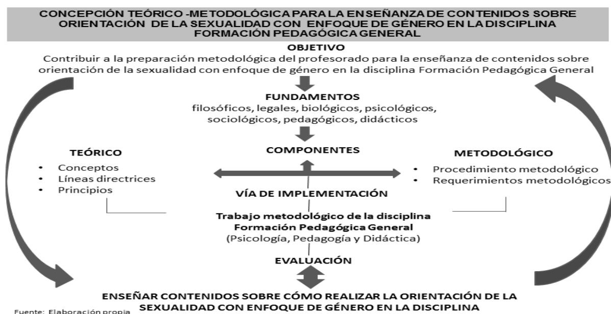
Gráfico 1. Representación gráfica de la concepción teórico-metodológica.

Se comparte este análisis a razón de que la concepción teórico-metodológica abarca ideas o puntos de vista y conceptos acerca de determinado proceso o aspecto de la realidad, así como orienta o direcciona la actuación con fines metodológicos. En consecuencia, la concepción teórico-metodológica que se propone en la investigación consiste en un conjunto de conceptos, líneas directrices y principios que actúan como premisas en el plano teórico; y por un procedimiento y requerimientos metodológicos que direccionan la preparación del profesorado de la disciplina Formación Pedagógica General, a partir de saberes científicos, profesionales y pedagógicos necesarios, para orientar la sexualidad con enfoque de género en el proceso de enseñanza aprendizaje como sistema didáctico.